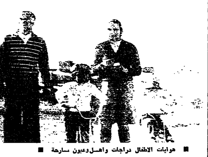
هوايات الاطفال دراجات واهل وبعيون سارحة

عطلة البحر تخضع الفضوليين تمتع الشمس للناس . ومنصة الشاطئ ، للاحلام . هذه المجموعات التي خرجت من بيوتها للاقاء البحر في عطلة الاسبوع ، كانت تحيي ما يطيب لها بعد انجاس : تقيم حلقات من الكوريات في ما بينها ، او محطت انتظار لبعضها البعض ، او تحضن الاطفال على طول الجناح الغربي . لكن الشيء الملائم والخالق في هذه العطلة هو البحر . هذا الوردع الازرق الذي يحضن الياسة ولا تتعبه احلام الفضوليين . فهذا الحلم الذي يقف ، قريبا من موج المتوسط ، ساحت عيشاه في البعيد ، خارج حلقات البروسين الجماعية ، واحب ان يناجي البحر على طريقته الخاصة .